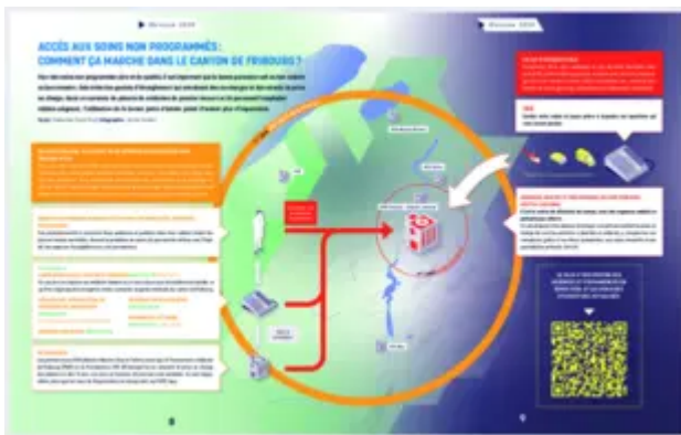
Accès aux soins non programmés: comment ça marche dans le canton de Fribourg? (1.86 Mo)