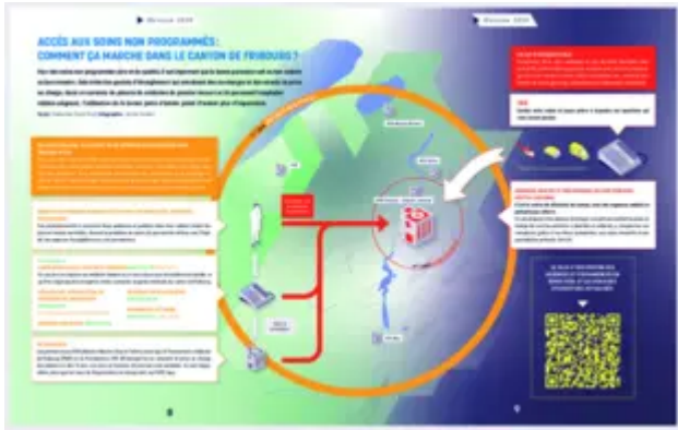
Accès aux soins non programmés: comment ça marche dans le canton de Fribourg? (1.86 Mo)